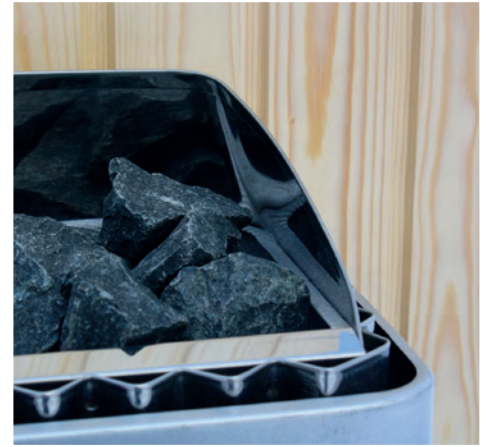
Solide og velprøvede løsninger helt til minste detalj